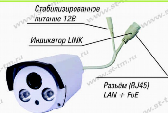
Рис. 1 Схема подключения